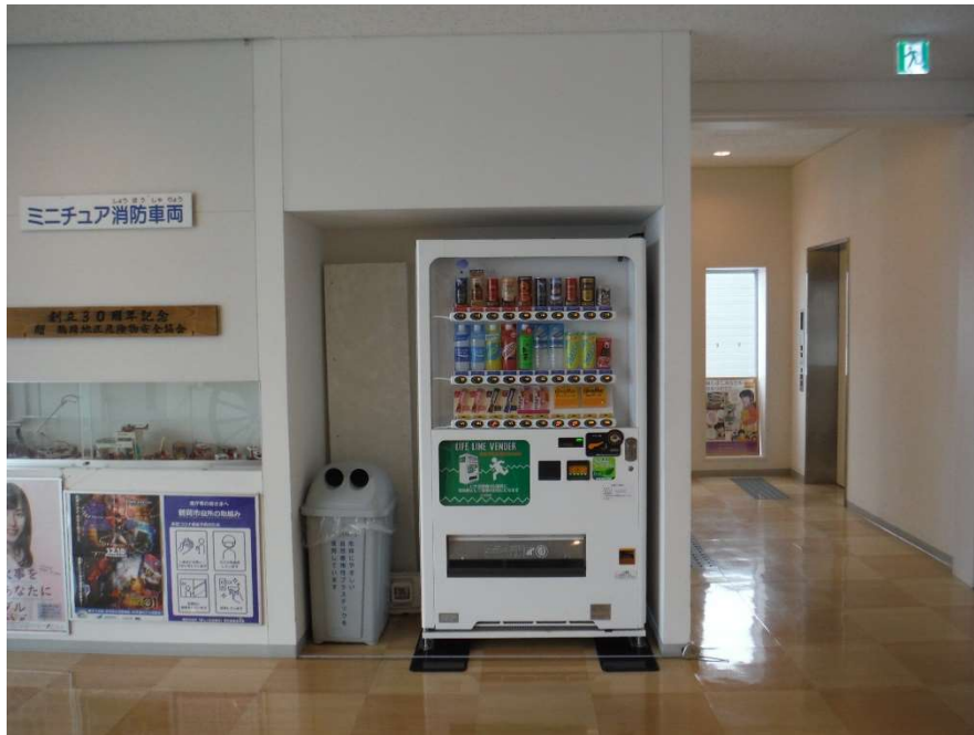
正面（W160cm × D75cm × H200cm）