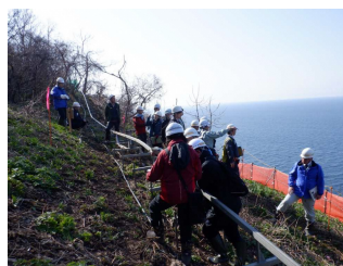
専門家現地調査状況