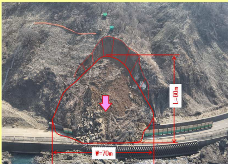
・道路を完全に塞いでしまいました・・・