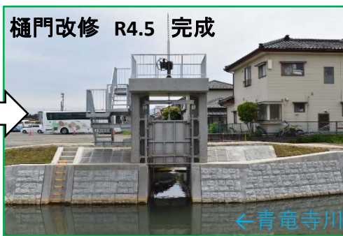
樋門改修による排水孔の大型化 縦2.2m・横2.0m