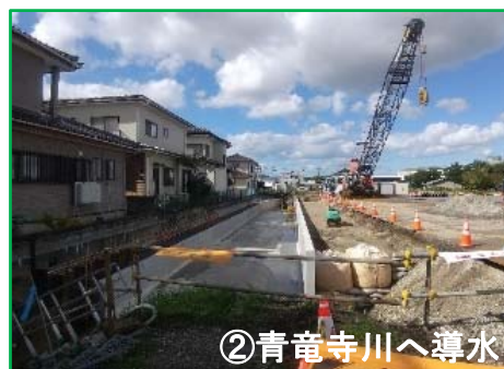
水路の大型化による浸水被害の緩和 縦1.0m・横1.5m→縦1.0m・横5.0m