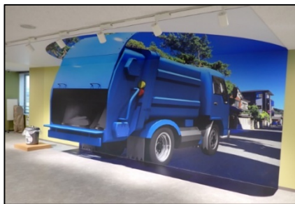
トラックアートなど、楽しい仕掛けも