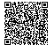
カラスの巣作りについて(市 HP)

一方で、カラスも野生鳥獣で生態系の一部であり、住み分けできることが理想です。カラスの生態を学び、共存できる道も考えてみましょう。