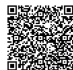
巣虫防除について(市 HP)

※高枝切りバサミは「アメシロ相談室」で貸し出しています。個人に対しても貸し出しますので、ご相談ください。