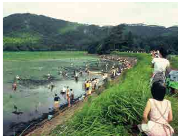
1985年、下池の土砂吐きと魚とり

「浮草組合」以外にも昔は、漁業(養魚)組合や海老組合、牧野組合などが存在し、多くの人が両池を含む周辺環境を活用していました。また、数年に一度は「土砂吐き(堀浚い)」を行い、池の水を抜き、水を入れ替えることで水質の維持も行っていました。その時には、大勢の人がコイやフナなどの魚を捕まえ、食料として池の恵みを享受していました。また、その光景を大勢の人たちが提体でみていたそうです。きっと、一大イベントだったのでしょう。