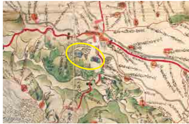
○枠内が正保庄内絵図に描かれている両池(致道博物館蔵)

大山上池・下池は、庄内最古の正保庄内絵図(1644年)に池の姿が描かれていることから、それ以前に治山治水の水害対策と農業用水の貯水池として築造されたと考えられています。時代や地域によって池の名前も変化しており、上池であれば「上ノ堤、上堤、上溜井堤、上湖」、下池であれば「下ノ堤、下堤、深湖堤」と呼ばれていました。