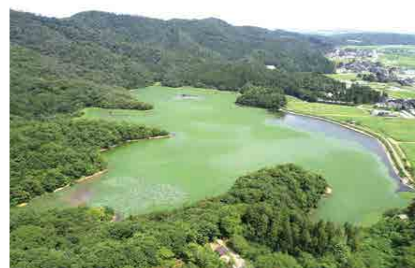
上空から見た下池