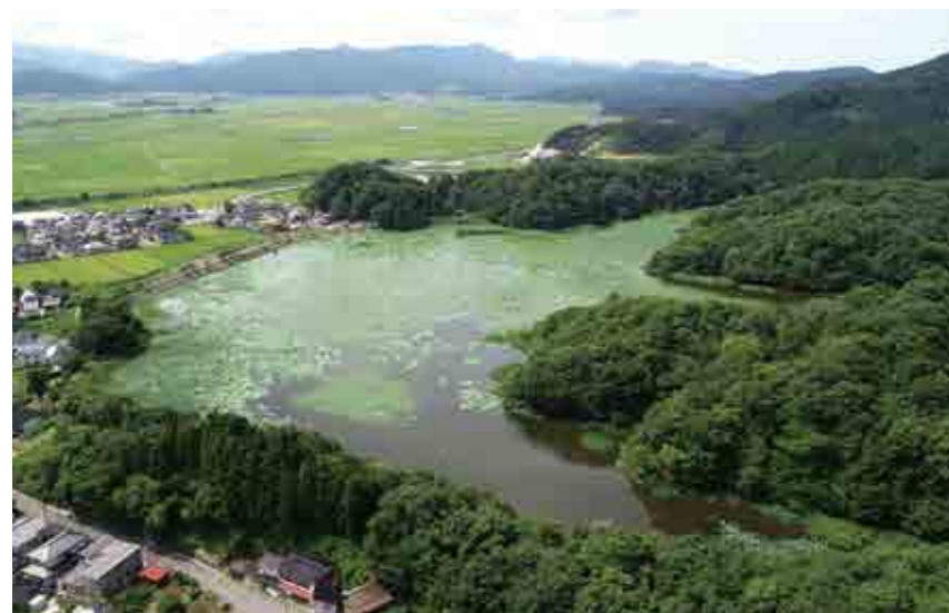
上空から見た上池