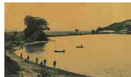
1930～1940年頃の上池での漁