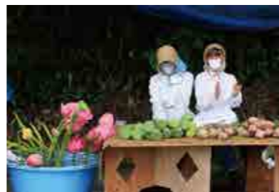
ハスの花や葉、果托を盆花として販売