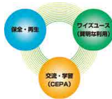
ラムサール条約の3つの柱

湿地の「保全・再生」、「ワイズユース(賢明な利用)」、これらを促進する「交流・学習(CEPA)」が、これが条約の基盤となる3つの考え方であり、お互いに支え合っています。その中でも、「ワイズユース」は、地域の人々の生業や生活とバランスのとれた保全を進めることが、湿地の生態系を維持し、湿地の恵みを持続的に活用することに繋がるという条約の特徴的な考え方です。