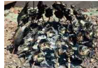
地域のお祭りで食べたフナの雀焼き

しかし、1990~2000年代頃になると池の水質の富栄養化が問題になります。その原因の1つとして、専門家からは渡り鳥が排泄する糞尿が指摘されました。この頃になると、下池の料理店や貸舟屋は閉まり、水生植物は食用などとして活用されなくなりました。さらに、池には当時ブームだったルアー釣りの影響でオオクチバスが放流され、ウシガエル、アメリカザリガニとともに増え、外来生物が生態系に影響を与えるようになりました。そして現在、池ではジュンサイも、泳ぐ子どもの姿も見ることができません。