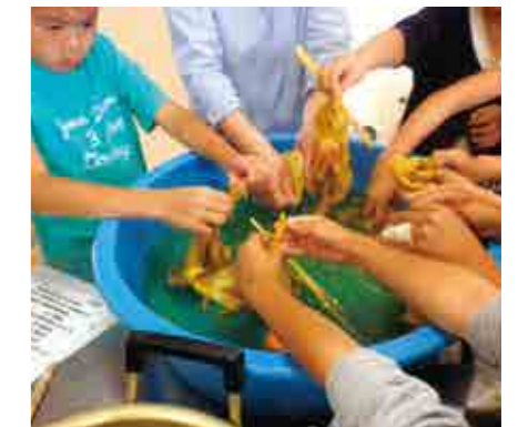
湿地の植物を活用した草木染め体験 (地元小学校の総合学習)

現在の私たちに、昔と同じような池とのかかわりを持つことはできません。しかし、現在の課題を池と人がかかわる新しい糸口と捉え、新しい池の魅力を発見することならできるかもしれません。