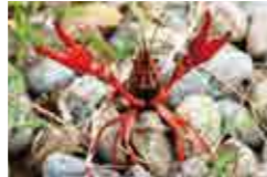
アメリカザリガニ