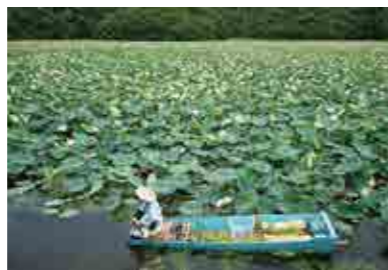
上池一面のハスと浮草組合の舟