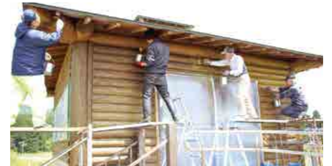
サポーターさんと愛鳥館のペンキ塗り作業