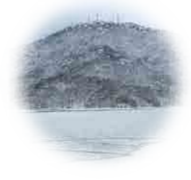
池全体が結氷した下池