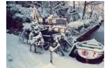
コイやウシガエルを食べさせる池近くの料亭