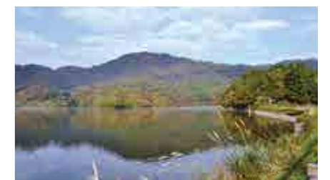
11月、紅葉した高館山と下池