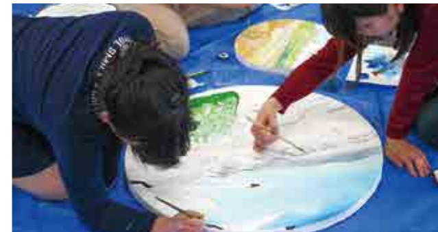
愛鳥館に飾る看板の色塗りワークショップ