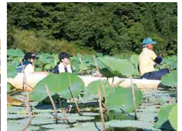
こどもラムサールワークショップでのハスの収穫体験