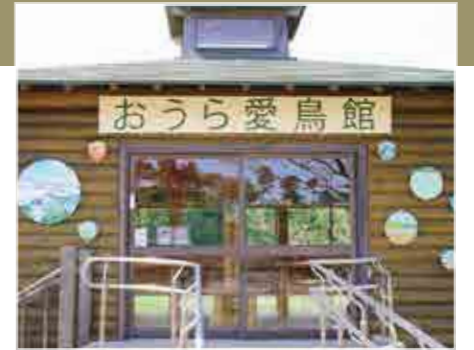
リニューアルされた「おうら愛鳥館」

しかし、建設から約20年が経ち、老朽化が目立つようになりました。そこで2018年、大山上池・下池がラムサール条約登録10周年を迎える機会に市民の皆さんと外壁のペンキ塗りと入り口に飾る絵を製作し、「おうら愛鳥館」をリニューアルしました。これからもたくさんの方から利用される観察小屋であってほしいです。