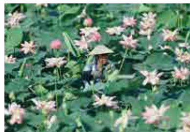
ハスの花や葉の収穫

1856年以前から続く「浮草組合」は両池を活用する代表的な組織です。組合では両池の浮草を採取する権利を持ち、現在も8月のお盆にはハスの花や巻葉、たんぼ(果托)の収穫販売、9月中旬にはハスの根茎(レンコン)の収穫を行っています。1933年の資料によると、組合ではハス以外にもオニビシやヒシを薬用や食用に、マコモ(がじき)は堆肥、フトイ(おひ)は草履などの藁細工、またジュンサイは料理用に収穫していたと記されており、多くの水生植物を活用していました。