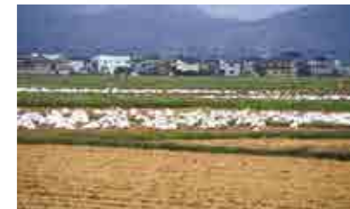
庄内平野で採餌するコハクチョウの群れ

今でこそ、両池は渡り鳥の越冬地として有名ですが、昔から越冬地として利用されていたわけではありません。昔は、冬になると採餌場である庄内平野は雪で覆われ、両池も結氷するため渡り鳥が越冬するには厳しい環境でした。多くの渡り鳥が越冬するようになったのは、地球温暖化の問題が心配され始めた1980年代後半のことです。コハクチョウの飛来は1988年からだといわれています。その後、毎年その数を増やし、コハクチョウやマガモをはじめとする多くの渡り鳥が越冬する「水鳥の楽園」と呼ばれるようになりました。冬の使者といわれるコハクチョウですが、もっとも多くみられるのは稲刈り直後の10～11月です。その後、池が凍るようになると南に下り、2月下旬～3月になると本格的な北帰行がはじまります。