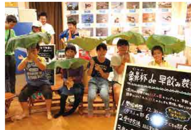
ハスの葉を活用した象鼻杯体験