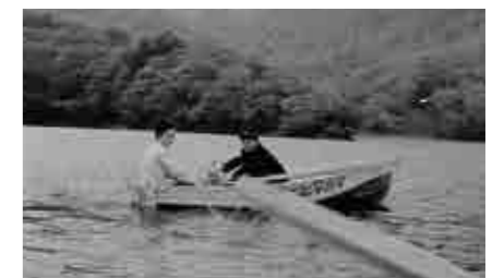
1960年頃の下池でのボート遊び