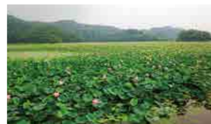
8月、上池全体にハスの花が咲く