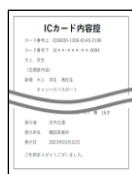
ICカード内容控の写し (庄内交通路線バスの場合)