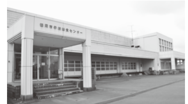
改築予定の鶴岡センター（白山）

答 旧町村地域のセンターをどう扱っていくかは検討課題であるが、老朽化した鶴岡センターの改築は急ぐ必要があり、施設規模については更に精査して、整備を進めていきたい。