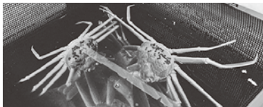
蓄養水槽で飼育されたズワイガニ