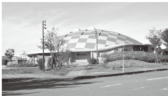
キッズドームソライ(北京田)