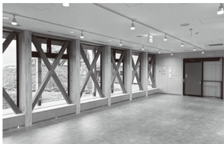
新朝日庁舎の多目的スペース内観

委員 新庁舎に市民が集えるスペースを設けるとのことだが概要は、 朝日庁舎総務企画課長 新庁舎は、令和7年6月30日の開所を予定している。庁舎1階に市民が予約不要で自由に使える、WiFiを完備した50畳ほどの多目的スペースを設置する計画である。このスペースは、バスの待ち時間や中高生の勉強、簡単な打合せなどでの使用を想定している。