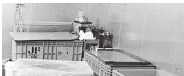
鼠ヶ関市場内に設置された蓄養水槽

農山漁村振興課長 同事業は、蓄養による出荷時期の調整や、活魚出荷を行う体制の構築を目指すものである。具体的には、由良と鼠ヶ関市場内に設置した水槽でズワイガニ等を蓄養し、高値の時期に出荷するなどの実証を行うものである。また、漁港での蓄養は、稼働率が低い港での実施が想定されているが、港内の砂の堆積等の課題もあるため、漁港の再整備も含めて県、漁協、漁業者等の関係者と検討を行う。