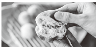
納豆菌粉で作ったパン