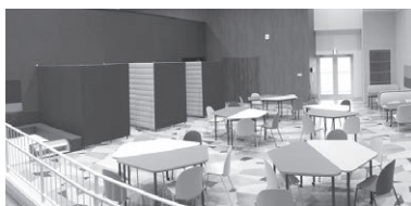
リニューアル工事が進む 出羽庄内国際村

金を活用してホームページを刷新するほか、イベントでは従来のワールドバザールや音楽祭等の内容拡充を予定している。また、外国人の生活相談窓口には、プライバシーに配慮した相談スペースを設置し、インターネットを活用した相談にも対応可能な環境を整える予定である。今後も外国人住民が安心して暮らせるように、やさしい日本語教室の開催など、多言語対応の充実を継続していく。