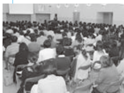
講演会の様子 (昨年11月19日/出羽庄内国際村)

子が親から大切にされるように、親も周りの人から認められ、子育てをねぎらってもらうことが大切です。それが自己肯定感を高める子育てにもつながっていくと思います。子が宝なら、子育ての最前線で頑張るパパもママもまた宝です。この宝を応援しましょう。心の痛みや苦しみに気付き合い、みんなで子育てを支え合う社会になることを期待します。