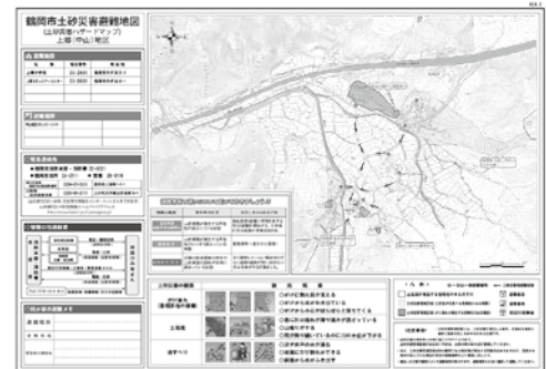
例：上郷(中山)地区の土砂災害ハザードマップ

長雨や豪雨に注意するとともに、斜面から小石が落ちてきたり、湧き水が濁ったり、土の腐った臭いがしたりするなど前兆現象を確認した場合は、早目に避難しましょう。