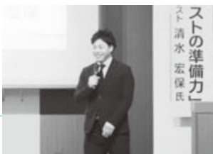
講演会の様子（1月15日／東京第一ホテル鶴岡）

しっかりと目標を定め、これからも事業への理念と情熱を持って取り組んでいきたいですね。