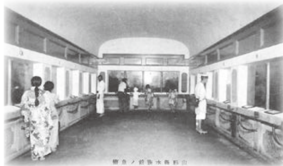
▲館内の様子（昭和5年）