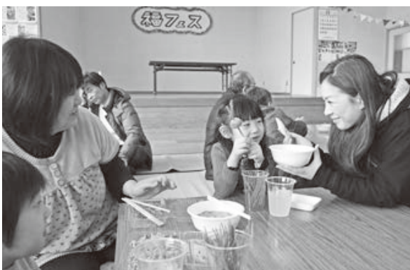
<越沢基幹集落センター>

畳の上の格闘技とも称される競技かるた。百人一首の上の句が読み上げられた瞬間、選手たちの鋭く札を払う音が響きます。