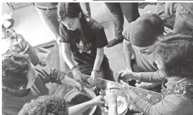
<学校給食交流：大泉小 出羽三山山伏修行体験：羽黒山 寒だら汁作り体験：鼠ヶ関地区 笹巻き作り体験：大鳥地区>