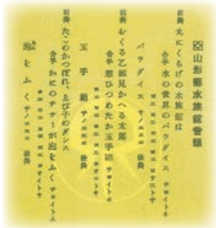
▲昔のパンフレットの一部