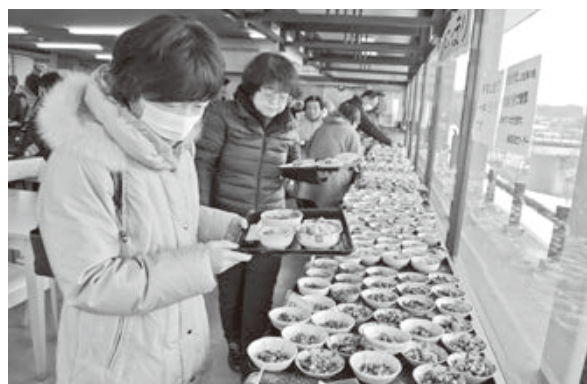
<産直あさひ・グー>

「これ僕のもの！」。市内の23園が卒園児たちの絵や工作などを展示。家族に作品を紹介した園児は誇らしげな表情です。