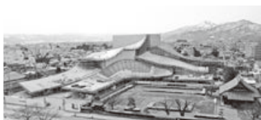
改築工事現場全景（3月現在）