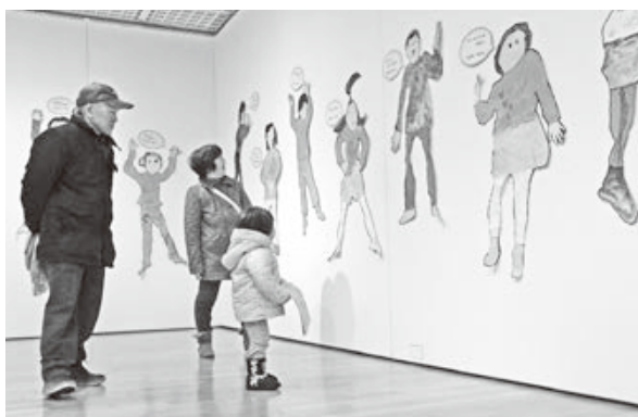
<鶴岡アートフォーラム>

など多様なテーマで鶴岡の食文化へ理解を深めました。各地区住民や生産者等との交流を通し、暮らしに根ざした食文化を体験しました。