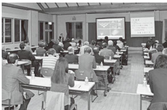
<手向地区地域活動センター>

春の訪れを告げるお雛様。参加者は城下町の町並みや歴史文化を巡りつつ、華やかな雛弁当・菓子に舌鼓を打ちました。