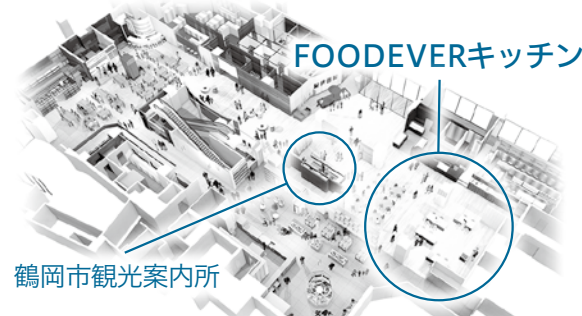
鶴岡市観光案内所

食に関するイベント、セミナー、料理教室、企業の商品PR、その他様々な展示を行うことができるスペースです。可動式の調理台を使ったり、プロジェクターで映像を映したりもできます。どなたでも利用できますので、ぜひご利用ください。