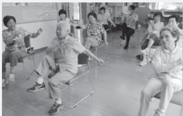
写真:いきいき百歳体操(藤島八栄島地区)