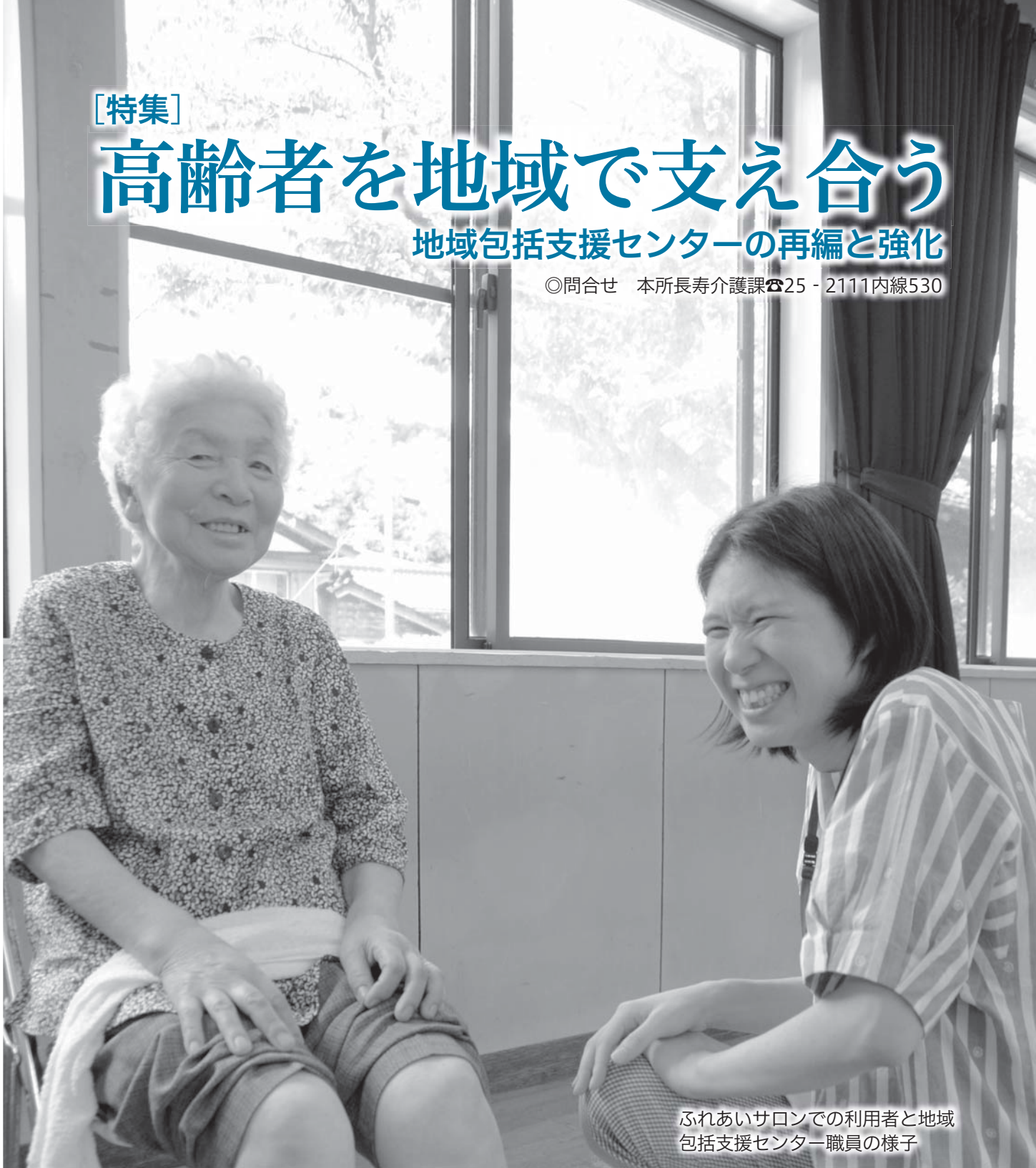
ふれあいサロンでの利用者と地域包括支援センター職員の様子

高齢者の暮らしを地域でサポートするための拠点施設「地域包括支援センター」。住み慣れた地域で安心して暮らしていけるように、介護や健康、福祉、医療、生活に関する様々な相談を受け付け、高齢者やその家族などを支援する身近な総合相談窓口です。