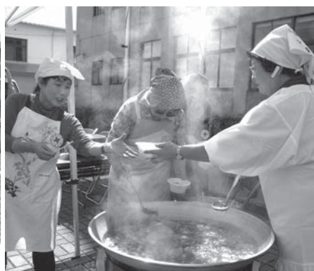
<泉地区地域活動センター、羽黒コミュニティセンター、羽黒体育館>