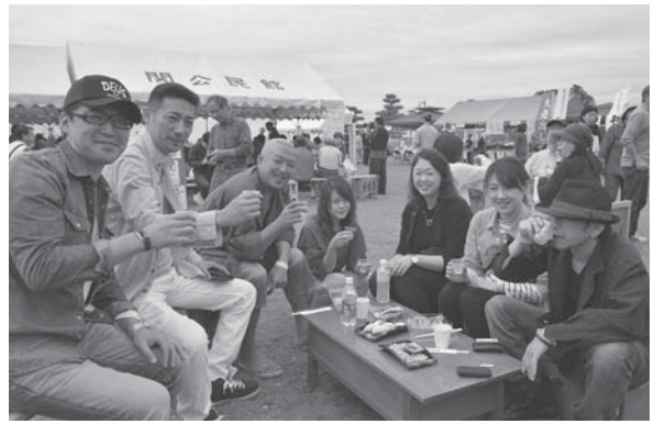
<マリンパークねずがせき>

9.21 ~ 10.31 大正7年9月21日に開業し、交通・物流の拠点として地域を支えてきた藤島駅。写真や新聞でその歩みを振り返りました。