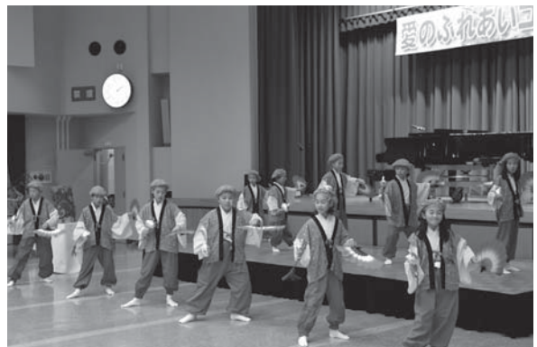
<朝日中央コミュニティセンター>

10.6 氷上で行うカーリングをヒントに誕生した室内スポーツ。選手たちは真剣な表情でローラーを滑らせ、得点を競いました。