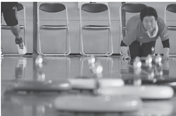
<櫛引スポーツセンター>

9.30 「おいしいね〜」。鼠ヶ関港で水揚げされたトラフグの刺身など海の幸を、地酒と一緒に満喫する行楽客でにぎわいました。