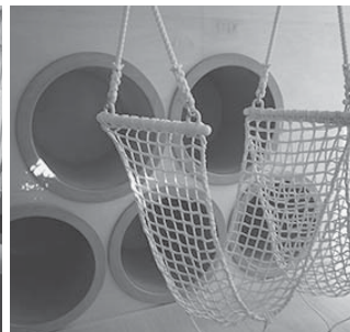
<サイエンスパーク>