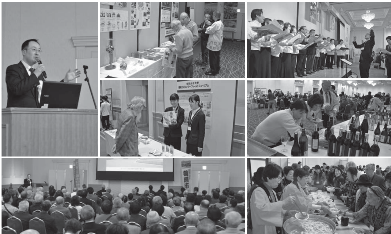
<タワーホール船堀（東京都江戸川区）>