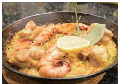
地中海風パエリア

バレンシアはパエリア発祥の地です。現地で食べたパエリアはこれまで食べたものと全く違う味わいでした。日本人がイメージするパエリアは、魚介類がたくさん入っているものだと思いますが、本場で使用する具材はシンプルです。食文化創造都市・鶴岡に住む皆さんも、今後スペインの人たちと接する機会があるかもしれません。その国の味を知っておいてもらいたいという思いから、本場で見たり聞いたりして教わった作り方を提供しています。