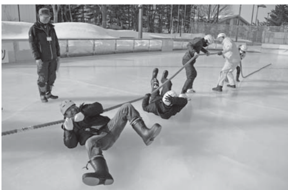
<小真木原スケート場>

「面！」「胴！」。小学生剣士が力強い掛け声と竹刀を打ち込む音を響かせ、冬の寒さを吹き飛ばす熱戦を繰り広げました。