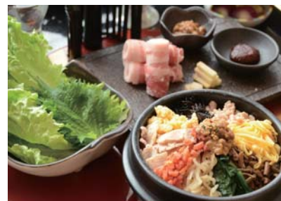
ビビンバとサムギョプサル

韓国で行われる大きな食のイベントに参加し、外国での料理や食文化に対する考え方に触れたことで、料理人としての視野が広がりました。全州はビビンバ発祥の地で、そこで作られたビビンバは完成されていてやはりおいしい。これを日本でどう表すかを考えたときに、日本の調味料、地元の食材を使って仕上げることにこだわりました。冬期間のみ営業のお店ですので、3月下旬まで、コース料理の中の一品として提供しています(要予約)。