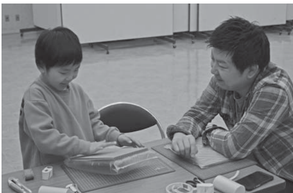
<櫛引生涯学習センター>

市民交流のため北茨城市から親子65人が来鶴。雪遊び体験や日本海寒鱈まつりへの参加など、冬の鶴岡を満喫しました。