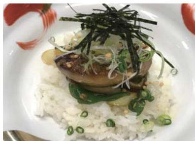
鶴岡産つや姫とフォアグラのかつおだし茶漬け

今回お店で提供する料理はバレンシアのイベントで作ったものです。鶴岡産つや姫に、しょう油の実を入れた甘辛いソースで味付けしたフォアグラ。そこに熱々のかつお出汁を注ぎ、和と洋の融合をお茶漬けという形で表現しました。1月に期間限定で提供した際、お客様に大変喜ばれたので、現地でのプレゼンテーションを地元で披露する良い機会を与えていただいたと感じています。3月31日までお昼限定で再度提供します(要予約)。