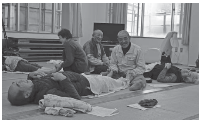
<木野俣集落センター>