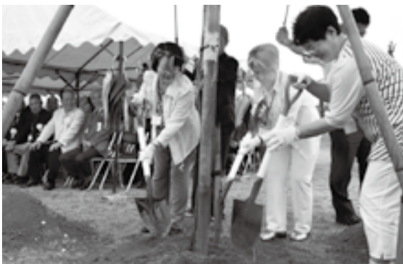
<丸岡城跡史跡公園>

降りしきる雨の中、参加者は雪溪の残る登山道を力強い足取りで進み、山頂の月山神社本宮を参拝しました。