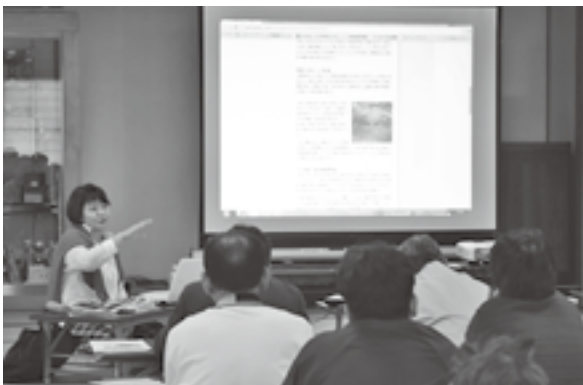
< 西荒屋地区公民館 >

11.23 『赤とんぼ』や『ちいさい秋みつけた』など情緒あふれる名曲を美しい歌声で披露。約1,300人の観客を魅了しました。