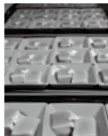
<グランドエル・サン>