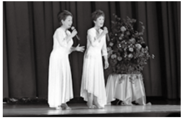
< 藤島体育館 >

11.20 「よいしょ」。餅をつく掛け声が響きます。自分たちで収穫した餅米のお餅。出来立てを頬張り、自然の恵みを味わいました。