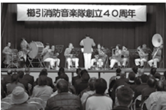
< 櫛引公民館 >

12.4 二人一組で縄をない、松ぼっくりやドライフラワーなどをあしらって、色とりどりのモダンなしめ縄飾りを作りました。