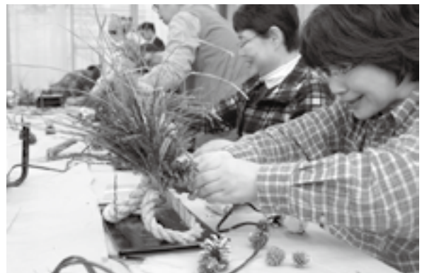
< 中央公民館女性センター >

11.24 14人の農家が参加。他地域の事例やお客様アンケートの分析を通じて、魅力ある観光果樹園づくりについて学びました。