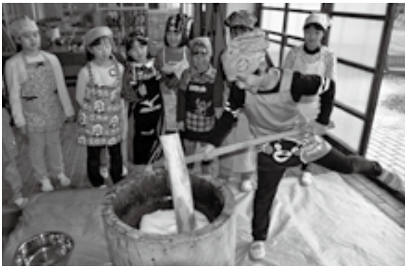
< 櫛引東小 >