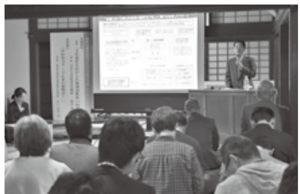
< 松ヶ岡本陣 >

12.6 市民と消防の懸け橋として活躍する音楽隊。曲にまつわる思い出話も交えながら、息の合ったハーモニーを奏でました。