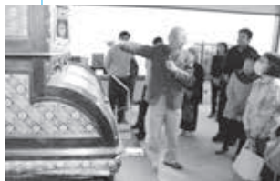
ギャラリー・トークの様子（4月20日／致道博物館）

今回の展示に持ってきたのは選び抜いた約180点。多くの方に見てもらって、寄木細工の魅力を感じてほしいですね。