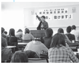
講演会の様子（2月10日／総合保健福祉センター〈にこ♥ふる〉）

私の講演を聴いたり私の本を読んだりした人を勇 気づけられたとして、効果が続くのは3日間くらい だと思います。まずは直接話をして、具体的に何が できるか一緒に考えることを続けていきたいですね。