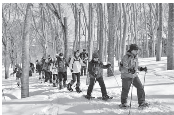
<湯殿山スキー場周辺>

「出羽三山神社に仏教建築の五重塔があるのはなぜか?」。かつて神仏習合だった信仰の歴史を資料から探りました。