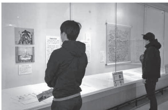
<いでは文化記念館>

旧園舎の老朽化に伴い移転新築。地元産木材を使ったぬくもりのある園舎になっています。新たに一時預かりや病児保育を実施するとともに、発達障害児支援を強化し、多様な保育ニーズに対応します。