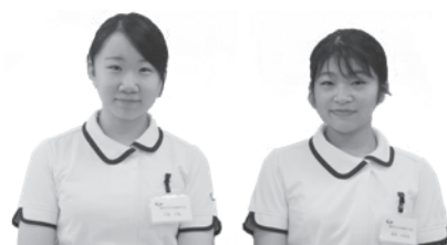
鶴岡市立荘内看護専門学校 学生自治会

差別の背景には知識不足や恐怖心があります。戦う相手は人ではなく、ウイルスであることを忘れずに、看護師の卵として頑張っていきます。