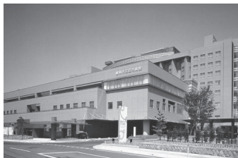
平成15年の新荘内病院開院にご尽力いただきました。

秋晴れのある日、羽黒山五重塔へ、玉川寺へ散策に出掛けた。風力発電の問題が決着がついたからか、それともオンラインの大学生として過ごす長女と一緒だったからか、久しぶりに開放感のある休日を通じた。また、別の週には、旧風間家住宅の丙申堂、別邸の釈迦堂へ、更には藩校致道館を訪れた。古い建物が好きなこともあり、威厳を感じながらもどこか落ち着く感じがした。この秋、県内、東北各地から70校以上の学校が、本市を修学旅行先に選ぶ、そんな動きが広がった。荘内藩の城下町、世界一のクラゲの水族館、世界に誇る食文化や温泉、3つの日本遺産を有する本市の底力が評価されたのだろう。 10月1日、新鶴岡市となって15周年の節目を迎えた。その日の朝、私は、旧温海町の戸沢に伺った。この日、温海地域乗合タクシーの試験運行が4つの路線（戸沢線、平沢線、関川線、菅野代線）で開始され、その出発式が行われたのだ。山間部から海岸部まで、東北で一番広い鶴岡市。通学や通院、買物など、毎日の暮らしに必要な移動手段の確保は、地域住民の切実な願いだ。温海地域では、地元自治会や観光福祉等の団体が運営主体となる協議会が本年5月に立ち上がり、準備が進められてきた。その前日には庄内交通の路線バスが廃止され、その代替手段の確保が必須となっていた。例えば、戸沢から五十川駅前までは200円、温海クリニックまでは400円で、月曜