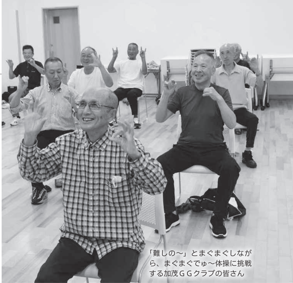
「難しの～」とまぐまぐしながら、まぐまぐでゅ～体操に挑戦する加茂GGクラブの皆さん