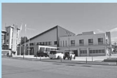
▲新朝日庁舎、消防署朝日分署が供用開始(6月30日)