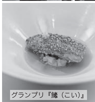
グランプリ『鱈（こい）』