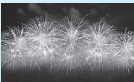
▲赤川花火大会で市制施行20周年記念花火を打ち上げ（8月16日）