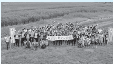
▲庄内自然博物館構想推進協議会、セブン・イレブン記念財団と「庄内セブンの森」事業連携に関する協定を締結（2月5日）