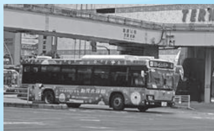
▲本市の名所や特産物などのデザインをラッピングした都営バスが運行（8月1日～令和8年7月31日）