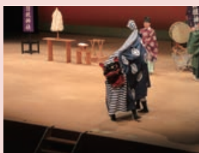
日枝神社獅子舞 (日枝神社獅子舞社中)