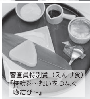
審査員特別賞（えんげ食） 『笹巻～想いをつなぐ えんげ結び～』