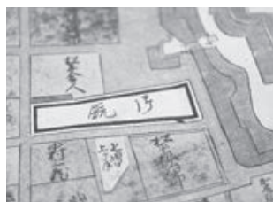
明和4年の鶴岡城下絵図

「馬医」といった役職が記されており、馬の世話係を配置していたことが分かります。 慶応3年（1867）の庄内藩の分限帳（家臣の情報が記載されている帳面）には、「馬乗」や