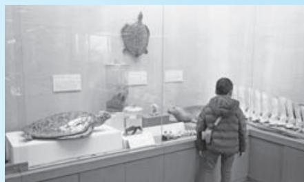
▲山形県立博物館と連携した「庄内自然史博物展」を庄内で初めて開催（1月25日～3月23日）