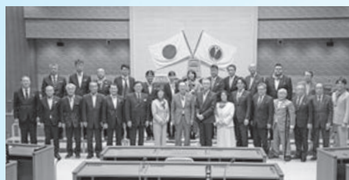
▲鶴岡シルクのスカーフやネクタイ等を着用して本会議に出席する「シルク会議」を初開催(3月4日)