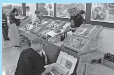
▲FOODEVER(フーデヴァー)でつるおかふうどマルシェを開催(5月〜12月に全6回)