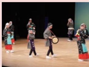
丸岡桐箱踊り (丸岡桐箱踊り等保存会)