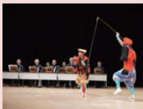
加茂泊町大黒舞 (加茂泊町大黒舞保存会)