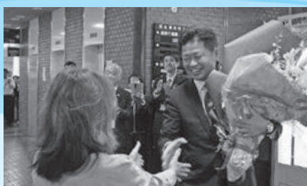
▲佐藤聡市長が就任(10月23日)