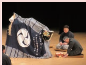
温海嶽熊野神社獅子舞 (温海嶽熊野神社獅子舞保存会)