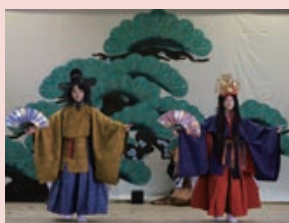
山戸能 (山五十川古典芸能保存会) 県指定無形民俗文化財