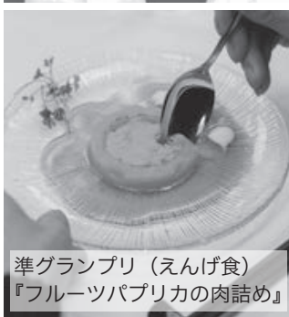
準グランプリ（えんげ食） 『フルーツパブリカの肉詰め』