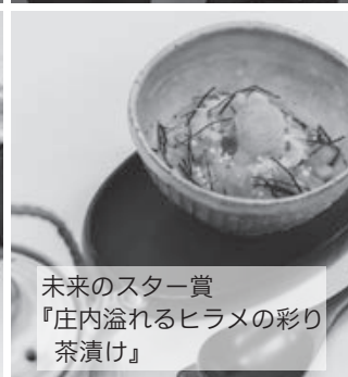
未来のスター賞 『庄内溢れるヒラメの彩り えんげ茶漬け』

テーマは「ウェルビーイング～鶴岡から未来に向けた最高の一皿～」。ウェルビーイングとは、身体的・精神的・社会的に良い状態を指します。最終審査に進出した料理人4人と学生2組が様々な技法を用いてテ-