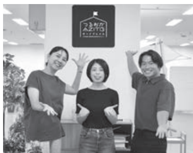
▲つるおかAZITOでは大学生と一緒に、日頃の悩みを分かち合うイベント「ももややお茶会」や、「推し」を語る会などを企画している。

山形市出身。東京大学理学部卒業後、新聞社に就職。2025年、鶴岡にJターン移住し、メタジェンセラピューティクス株式会社に入社。同社つるおか献便ルーム長として、先端科学と市民との橋渡しに奮闘中。仕事以外では「つるおかAZITO」の管理人のほか、「石ナイト」を運営する。好きな鉱物は方解石。もらった山菜の調理や食べ歩きを通じて、食が豊かな地で暮らす幸せを日々感じている