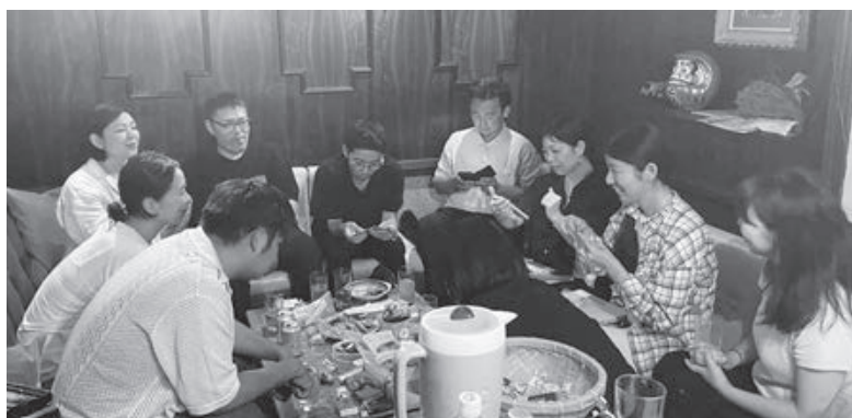
▲市内飲食店で開催した「石ナイト」。参加者がお気に入りの石を持ち寄ってしゃべり、異なる観点の「石好き、同士で新たな交流が生まれた。