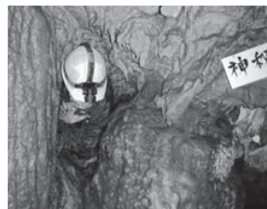
▲大学時代は鍾乳洞をフィールドに古気候学を専攻。実習や調査のため、日本各地の狭い洞内に潜り込んだ。