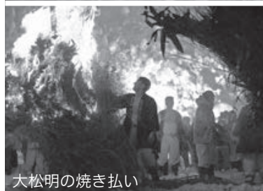
大松明の焼き払い