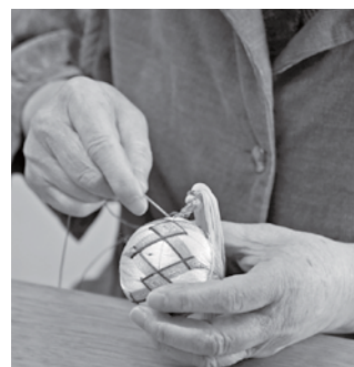
▲慣れた手付きで集中して縫っていく。仕事部屋はしんと静まり返っていた。