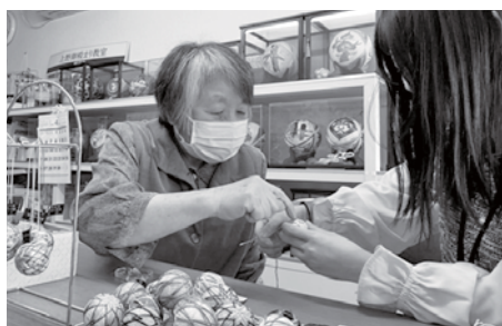
▲祖母が始めた上野御殿まり教室の主宰を引き継ぎ、随時体験教室を開いている。わずか30分で小さな御殿まりが完成できるようにするなど、気軽に体験してもらえる工夫をしている。