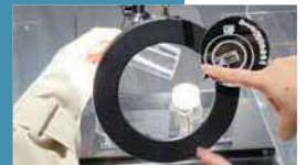
マイクロアクアリウムで小さなクラゲを観察

世界中の様々なクラゲを約100種類展示。時には海外に足を運んで、新たなクラゲを採集することもあります。また、「クラゲに関する100の質問コーナー」など、職員お手製の楽しく学べる展示が並ぶほか、マイクロアクアリウムの壁には、クラゲの生態や共同研究の内容がびっしりと描かれています。