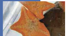
庄内浜の磯辺に生息するヒトデ

「かもすいに来たからには庄内浜に生息する生き物を知ってもらいたい」という思いから、庄内浜近海の魚や深海生物、磯辺に生息する生き物を展示しています。併せて、旬の魚やその食べ方も紹介。水族館で庄内浜の魚を見た後に、実際に自宅や市内のお店などで味わいたくなるよう工夫しています。