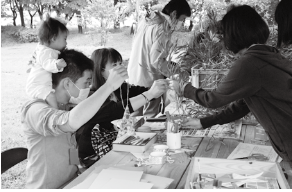
< 櫛引庁舎南側緑地 >