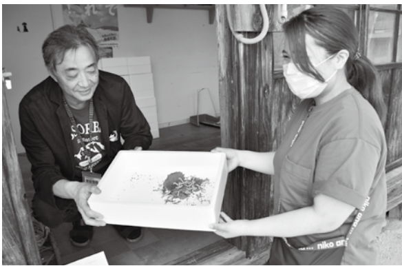
< 松ヶ岡開墾場 >

6.5 自然と調和した生演奏が魅力の音楽祭。2組の演奏を聴きながら、大鳥でしか味わえない山菜料理などを楽しみました。