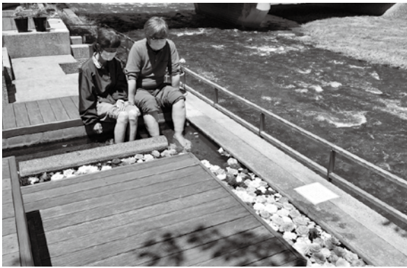
< あつみ温泉 >