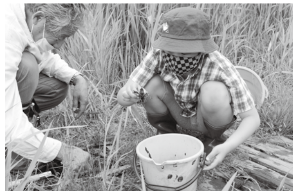
< 自然学習交流館ほとりあ周辺 >

6.8 ~ 10 「繭になるまで大切に育てます！」絹文化の普及啓発のため、保育園や福祉施設等に約3,600頭の蚕が配布されました。