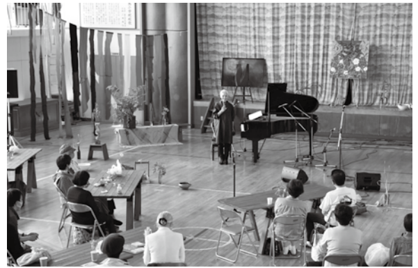
< 大鳥自然の家 >

6.1 ~ 30 期間中の土曜日は、足湯に色とりどりのバラが浮かべられました。訪れた人は、鮮やかな色と香りに癒やされていました。