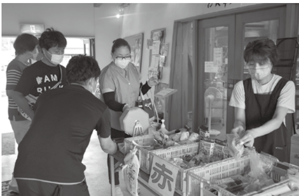
<道の駅「あつみ」しゃりん>