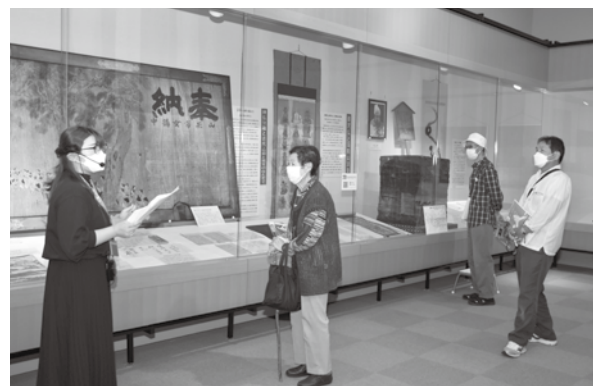
<いでは文化記念館>

旧庄内藩主酒井家や藩士の家に伝わる武器・掛け軸・茶道具等を展示。訪れた人は庄内の歴史の奥深さを感じていました。