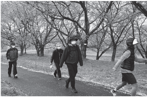
<写真：やすらぎ公園>