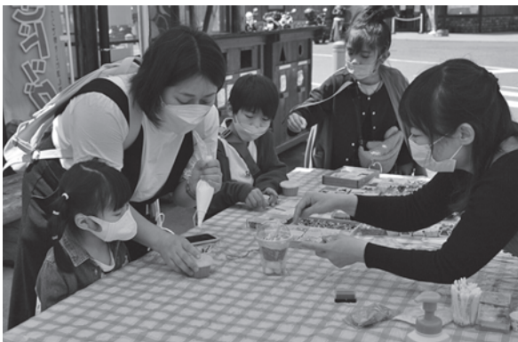
<道の駅「あつみ」しゃりん>

昨年12月の発見時の状況や出土した金峯石について、市の職員が解説。参加者は、江戸時代のお城の名残に触れました。