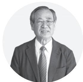
城下のまち鶴岡将来構想 策定委員会委員長