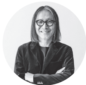
城下のまち鶴岡将来構想 策定委員会アドバイザー

ビジョンは、鶴岡駅前前のグランドデザインと、その実現に向けた実行計画案で構成されています。このビジョンが鶴岡駅前を生まれ変わらせるだけにとどまらず、鶴岡市全体ににぎわいを広げてゆく、人とまちを育てる鶴岡市の指針となることを期待します。