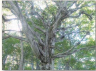
街道のシンボルであり、千手観音のように枝を広げる「千手ブナ」

め、清川付近の残雪が多く雪崩の危険があったことから、急ぎよ六十里越街道を通ることになったのです。