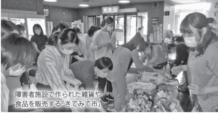
障害者施設で作られた雑貨や食品を販売する「きてみて市」