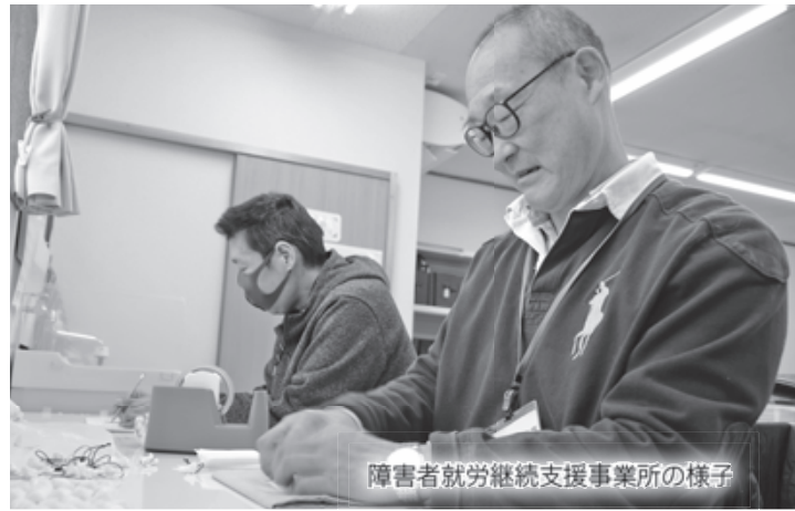
障害者就労継続支援事業所の様子