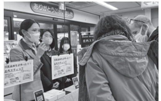
▲羽黒高校生たちと一緒に開発したお菓子「庄内スティック」が1月12日に発売されました!

東京都北区出身。小・中学生時代はサッカーを、高校、大学ではラグロスをしていた。俊足。ゴルフ、スノーボードなど自然の中でのアクティビティや、温泉・サウナで疲れを癒やすのが好き。最近は釣りもたしなむ。