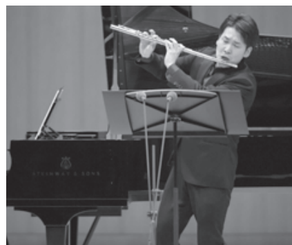
▲日本音楽コンクール本選。東京オペラシティコンサートホールでダイナミックな演奏を披露した。