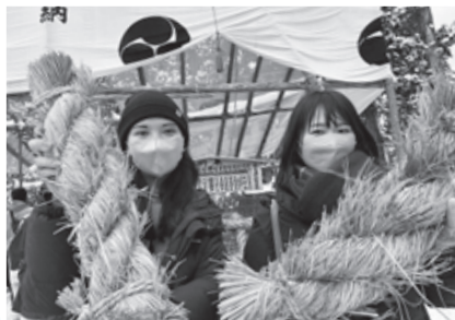
▲12月31日は松例祭を見に行きました(写真左)