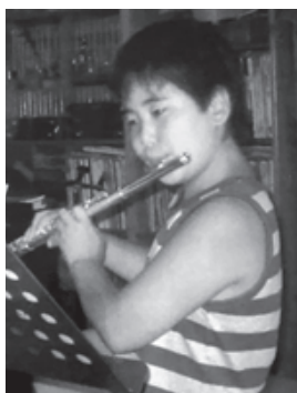
▲小学校5年生の夏休み、レッスン中の一コマ。真剣な表情がうかがえる。

鶴岡市出身。鶴岡南高校を卒業後、京都市立芸術大学音楽学部へ入学。同大学院音楽研究科修了。昨年の第91回日本音楽コンクールフルート部門で第2位及び岩谷賞（聴衆賞）を受賞。2021年・2022年には京都・東京・鶴岡でソロリサイタルツアーを開催。趣味は家庭料理。京都生活の中でも「はえぬき」を食べ続ける庄内米ファンでもある。