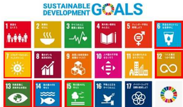
SDGsで掲げる17のゴールと特に環境と関わりが深い6つのゴール

2015(平成27)年9月に「国連持続可能な開発サミット」において採択されたSDGsは、「誰一人取り残さない」社会の実現を目指し、環境・経済・社会をめぐる広範な課題の統合的解決を目指す全世界の共通目標であり、2030(令和12)年を目標年として17のゴールと169のターゲットを掲げています。