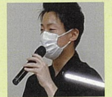
温泉ソムリエによる健康講座