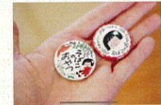
缶バッジのイメージ