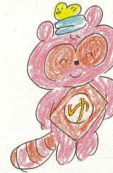
ゆ〜Townキャラクター 『ゆ〜たん』