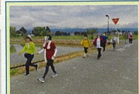
早朝ウォーキングと朝スパ