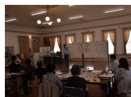
（写真：ワークショップの様子）

ワークショップにおける地域住民・関係者の意見をふまえ、平成6年に策定した計画の「活用の基本方針」をベースに新たに「利活用の基本方針」として提示し、それらを着実に進めていくための管理・運営等の体制構築の方針も示すものとする。