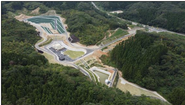
一般廃棄物最終処分場