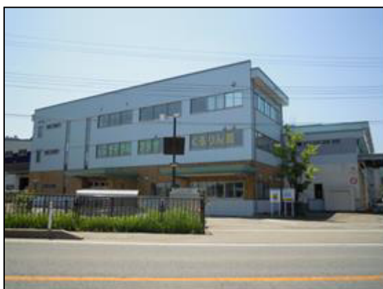
リサイクルプラザ