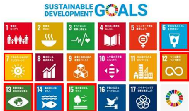
SDGsで掲げる17のゴールと特に環境と関わりが深い6つのゴール

2015(平成27)年9月に「国連持続可能な開発サミット」において採択されたSDGsは、「誰一人取り残さない」社会の実現を目指し、環境・経済・社会をめぐる広範な課題の統合的解決を目指す全世界の共通目標であり、2030(令和12)年を目標年として17のゴールと169のターゲットを掲げています。