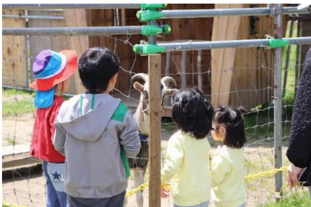
2年目を迎えたヤギの飼育

*2022年度より、正解者から抽選で選ばれた1名にコハクチョウのぬいぐるみとともに湯田川温泉の宿泊ペアチケット券を贈呈