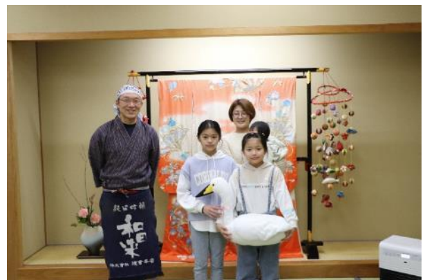
コハクチョウ初飛来日あてコンテストの 当選者への副賞授与式