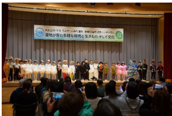
オープニングの様子 (大山保育園)