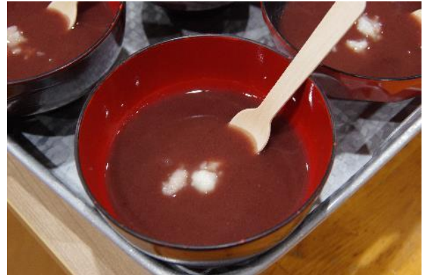
ヒシの実入りぜんざい