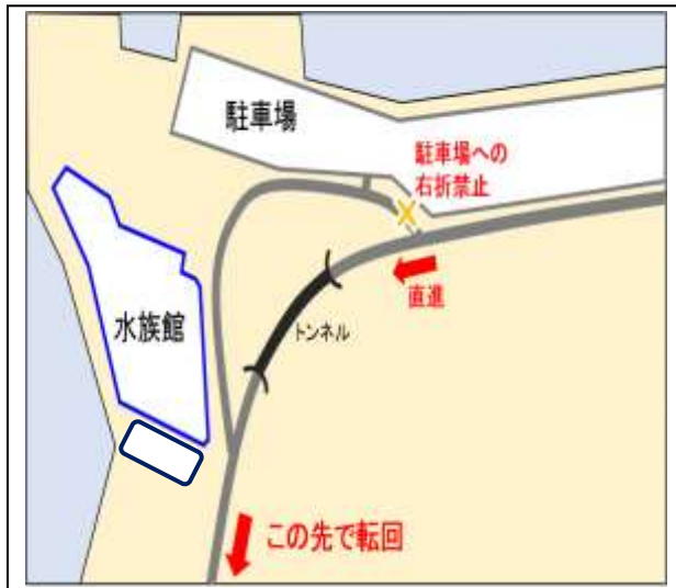
【駐車場への右折入場禁止】