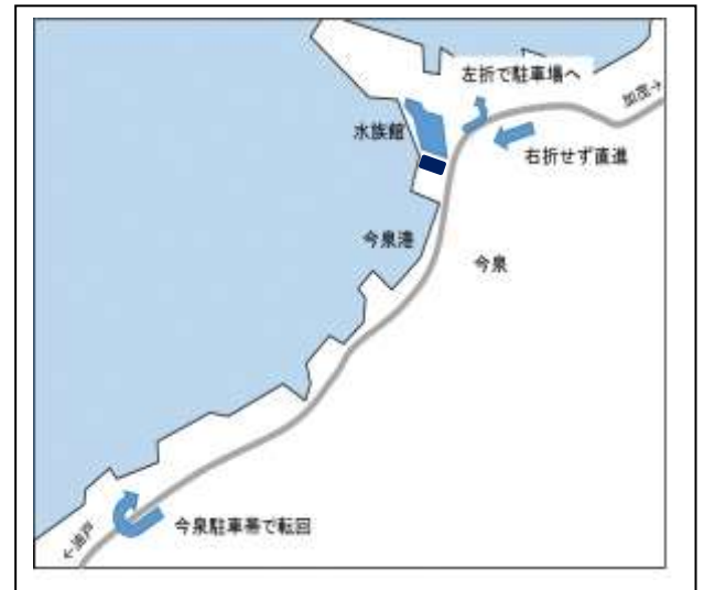
【今泉駐車帯における車両転回】