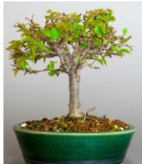
(↑写真はイメージです)