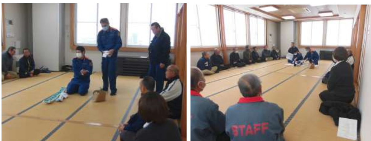
●応急処置対応の訓練の様子

また、シーズン前には、従業員研修の一環として、傷病者の搬送要領、応急処置について実技を実施しました。