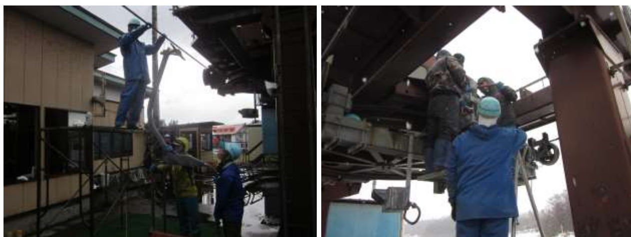
●輸送機器の点検整備の様子

安全輸送に関する従業員の研修を定期的実施するとともに、整備細則に則り機器の点検整備や更新を行い、その結果については安全統括管理者へ報告を行いました。