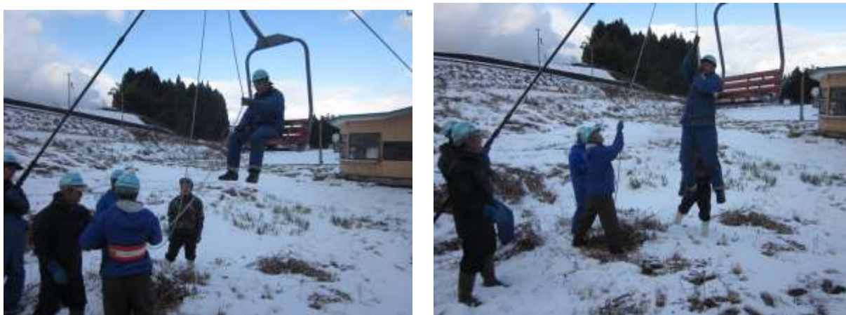
●リフト停止を想定した救助訓練の様子

シーズン前にすべての従業員を対象に、リフト停止を想定し、通報・救助・報告までの救助訓練を現場で実施しました。