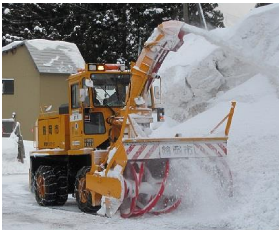
ロータリ除雪車 (NR302/2.6m幅/250PS)