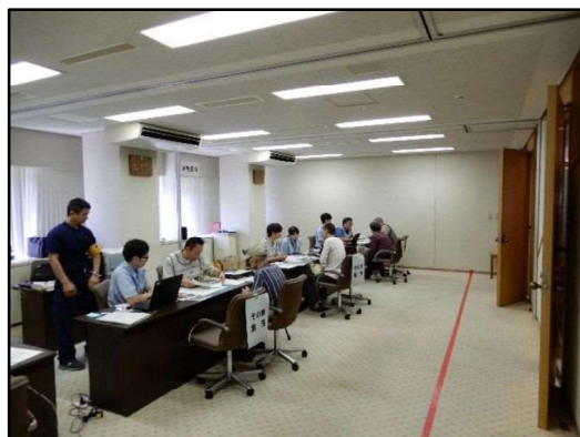
【り災証明書発行窓口の風景】