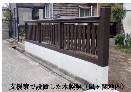
支援策で設置した木製塀（鼠ヶ関地内）

○補助率：事業費の1/2か40万のいずれか低い額。ただし、次の①②は対象外。①補助対象経費が10万円未満の工事 ②産業廃棄物の運搬費と処分費。②の運搬費の除外については、他課の支援事業との重複を避けたもの。（補助率1/2のうち、県負担1/4、市負担1/4） ○予算：木製塀設置単価を60千円/m、事業採択件数を対象件数の1/3相当の30件と見込み12,600千円を7月臨時会で予算措置した。