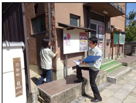
【被害認定調査研修の様子】

研修の講師は、今回派遣された職員も務めており、市職員全体のスキルアップをめざして来年度以降も実施する予定です。