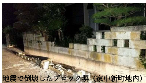
地震で倒壊したブロック塀（家中新町地内）

支援内容については、それぞれの担当部局（県：森林ノミクス推進課、市：農山漁村振興課）が調整し、県は7月議会に追加提案、市では7月臨時会で予算措置した。