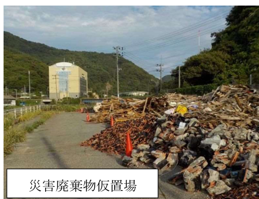
災害廃棄物仮置場

仮置場の設置は当初7月31日までとされていたが、多くの家屋で屋根瓦等の修復が思うように進んでいない状況を踏まえ、受け入れる災害ごみを瓦等に限定したうえで、岡山最終処分場を12月20日まで、温海地域は1か所とし10月31日まで延長し、当課職員が運営に当たりながら復興支援を行った。