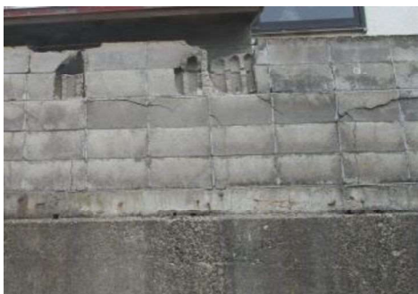
崩れかけたブロック塀

油漏れについては、消防署で設置した油吸着マットの設置場所を確認し、収束後に市や住民で回収することとした。