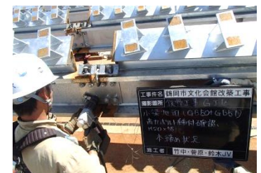
写真4：ボルトジョイント工事施工状況

今後ご近隣の皆様にご迷惑をお掛けしないよう、最大限の注意をはらい、安全に作業を行ってまいります。工事に関しまして、何かお気づきの点がございましたら、下記までご連絡頂けますよう、お願い申し上げます。