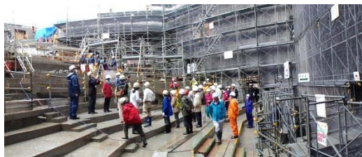
写真1：第2回現場見学会の状況

4月29日（金・祝）に第2回現場見学会を開催しました。申し込まれた見学者の皆様に、工事の内容・進め方等を現地で説明しました。今秋も開催する予定があります。詳しくは鶴岡市広報でお知らせします。