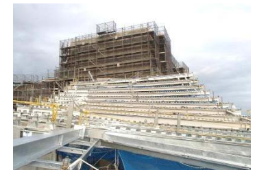
写真3：鉄骨取付状況（現場西側屋根の状況） ⇒曲面形状の屋根に合せた屋根鉄骨