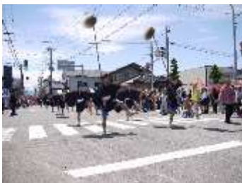
※8：大山犬祭り 中学生の奴振り