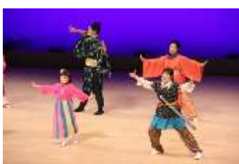
※12-3：芸術フェスタ ミュージカル