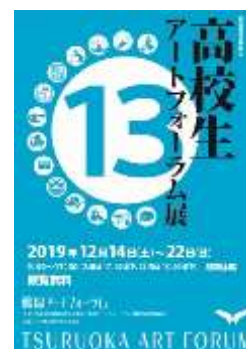
※3：高校生アートフォーラム展ポスター

小学校の3年生以上は総合的な学習の時間があり、各校が特色ある「ふるさと学習」などを実施しています。東栄小学校では地域に伝わる獅子踊りを練習(※7)します。上の学年が下学年に伝える異学年の交流や地域との結びつきや伝統を守るために行っている学習です。成果を地区運動会で披露します。榎引東小学校では全校で黒川能の謡の練習をして、「水焰の能」に子どもたちが参加します。大山小学校では「大山いざや巻」という踊りの担い手がないという相談が地域の方からあったそうです。学校では三年生の総合の時間に「いざや巻」をやっている人に来ていただき紹介してもらい、興味をもった児童が4年生以降、学校のクラブ活動の時間に地域の方から「いざや巻」を指導してもらいます。中には学校教育以外の場でも活動して、発表する機会もあったそうです。次は5中の