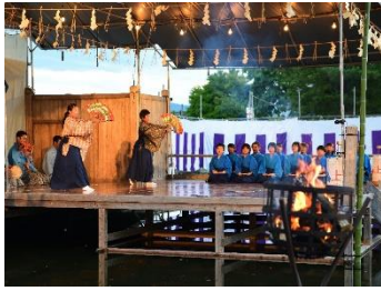
※12：櫛引東小学校児童の 仕舞発表。「水焰の能」

子どもたちに教えて面白いのは、失敗した時は、こっちが何も言わないでも「もう一度やる」という言葉が出てきます。同時にいい感じでやった時は大人では考えられないような成就感をもって、満足げに舞台袖に帰ってきます。発表する場（※12）があることで、子どもたちは生きてくる。発表するには稽古をさせなければならない。どの活動も少子高齢化で活動を維持していくには若い方が入らなないとつながっていかない。そこをどう引きずり出すか、その興味付けにこのタクトもそうですし、色々な施設を使うことが重要になってきます。同時に、タクトがタクトの中だけでなく、タクトが外に出ることも必要だろうと。内側と外側で力を出し合うことで、活力が違ってくることを感じています。