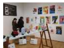
※4：中央高校美術デザイン系列展