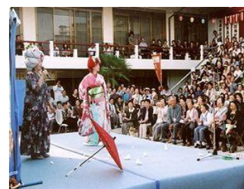
※9：八老劇団（大阪府八尾市） 平均年齢 73.7 歳

一方で特に地方で文化を考えるとときには、超高齢化社会と文化のあり方が重要ではないかと思えます。ご存じのとおり、日本は世界でもっとも早く、しかも最大規模で超高齢化社会に突入したわけですよ。皆さんも新聞をご覧になっていると、かならず高齢に関する記事が出てきます。ことごとくが暗い記事です。例えば、高齢者のドライバーが事故を起こしたとか、逆に高齢者の事故が多いとか、高齢者が増えることによって国の財政がもたないんじゃないとか、認知症患者がこのままいくと世界最大規模になるぞとか、施設で虐待があるとか、暗い話題ばかりです。ただ、この高齢社会は、変えられない未来で、確実にそうになっていく、であれば、そんな未来であれば、それを暗いと言っているのではなくて、いかに明るい社会にしていくのかが、日本の大きな課題だと思います。そこに文化芸術が大きく貢献できるんじゃないかなと、私は思っています。