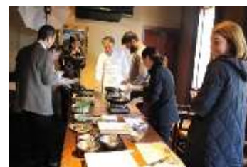
※8-1：体験型ツーリズム 調理体験

最後にどうやって情報発信するか。来てもらうことから参加型へどう変えていくか、色々なイベントをしているのでどう集約していくのか、この辺が課題なので、それぞれに答えを用意していきます。SNS の活用が重要で、Facebook では日本語、英語とフランス語で情