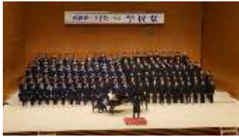
※6：中学生の学年合唱