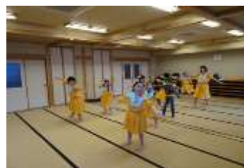
※11：こども文化クラブ（フラダンス）