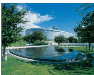
※2：りゅーとぴあ 新潟市民芸術文化会館

ここから鶴岡がどういう方向に向かうか、参考になる話をしていきたいのですが、それが単なる文化芸術の領域にとどまらない、総合政策としてやっていこうという大きな枠組みができています。総合政策と言っても、言葉では分かるけどどんなものでしょうということになります。なので、法律が出来る前から全国の自治体が様々な取り組みがなされていますので紹介していきます。