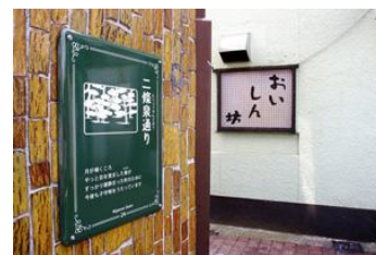
※8：地域住民とのワークショップで名付けた小道のサイン

アート・マンス（※7）という市民芸術祭をやっています。市民がやっている活動を展示したり、発表したりするのですが、市民芸術祭というと、ずっと続いている、どよんとした感じになってしまうのですが、「ベップ・アート・マンス」と名付けて、少しおしゃれな旗を作ると、すごくイメージが違います。面白いのは、温泉街で小道とかありますが、そういう小道に地域住民を交えたワークショップを通じて名前を付けていく（※8）。これも一種の広い意味での文学的なアートとしてとらえられています。