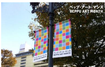
※7：ベップ・アート・マンス別府市内に掲示された旗

あと面白いのが、大分県別府です。温泉地として名高いまちですが、古い温泉地ですので、大きいホテルもたくさんあるけど廃業するところも出てきた、そういう構造的な不況に入っている都市ですが、ここでアートで別府をもっと活性していこうと BEPPU PROJECT という NPO が活動をしています。色々面白い活動をしていいますが、アパートをアーティストやクリエイターのための居住・制作の場として活用して、人気の拠点となっているし、ベップ・