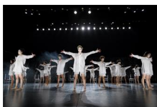
※3：Noism Company Niigata 『Fratres III』 演出振付：金森稔

ここから鶴岡がどういう方向に向かうか、参考になる話をしていきたいのですが、それが単なる文化芸術の領域にとどまらない、総合政策としてやっていこうという大きな枠組みができています。総合政策と言っても、言葉では分かるけどどんなものでしょうということになります。なので、法律が出来る前から全国の自治体が様々な取り組みがなされていますので紹介していきます。