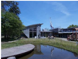
※1：鶴岡市中央児童館 「ひろっぴあ」

専門は、果樹園芸学・園芸利用学ならびに人間植物関係学（果樹の栽培と利用、果物と人との関わりなどの研究）。博士（農学）。各種講演やシンポジウム、まちづくりなどのコーディネーター役を務めながら地域の食と農、人と人とのつながりづくりにも取り組んでいる。鶴岡総合研究所所長、山形在来作物研究会副会長、鶴岡市総合計画審議会委員。