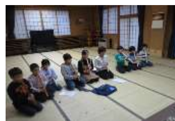
※10：こども文化クラブ（尺八）

子供たちが放課後を安全・安心に過ごし、多様な体験・活動ができるよう、地域住民の参画を得て放課後等に学習や体験、交流活動などを行う事業。