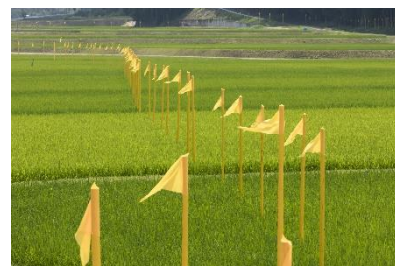
※1：「大地の芸術祭 越後妻有アートトリエンナーレ」 磯辺行久「川はどこへ行った」

次に国際文化交流の推進に関する法律、これは何かというと、日本全国で、様々な国際的な芸術祭があります。瀬戸内海で開催される「瀬戸内国際芸術祭」は会期が100日くらいで、のべ100万人くらいがやってきます。近いところでは、新潟県の十日町のエリアで「大地の芸術祭 越後妻有アートトリエンナーレ」(※1)が3年に1回開かれています。こうした地域で開催される国際的な芸術祭が実は、地域の活性化とか、訪日外国人の誘致にも大きな役割を果たしているだろうと。こちらも国としてもっと推進していこうと、いうことで特別な法律ができています。