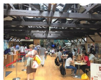
※7：まちなかキネマ 設計：(株)設計・計画高谷時彦事務所。平成22年竣工。