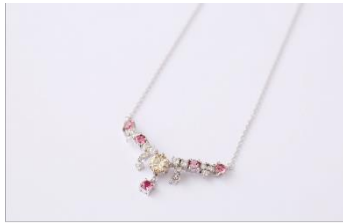
※8：リメイクのネックレス