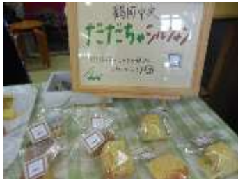
※1：だだちゃシルフォン

(庄内地区高等学校文化連盟会長 鶴岡中央高校校長) 昭和62年山形県公立高等学校教諭採用。山形中央高校、酒田西高校、酒田東高校勤務。県教育センター指導主事、農林大学校副校長などを経て令和元年度から現職