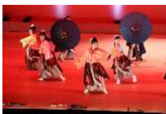
※12-2：芸術フェスタ よさこい