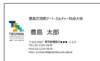
※5：アトカル特命大使名刺

次に都心の事例になりますが池袋があるエリアの豊島区です。人口29万人、ここも文化に力を入れている都市で「国際アート・カルチャー都市構想」があります。ここを紹介するのはなぜかというと、構想に基づき「国際アート・カルチャー特命大使（通称アトカル大使）」という制度を設けています。平成30年でこの特命大使は約1,400名になりました。人口29万で1,400人が大使になっている、結構な数ですね。アトカル大使になると何がメリットがるかというと、名刺（※5）をもらえます。あとは情報がもらえます。情報は今時だれでももらえますが、年会費を5,000円払います。名刺代にしては高いですね。1,400人くらい大使がいますから、アトカルの事務局には結構な予算が集まるし名刺代を出してもだいぶ残ります。残ったお金で大使の人たちが文化活動をしたいという希望があるので、公募制の助成プログラムがあり、提案してきた人たちを審査して助成金を出すという仕組みです。すごい活動のようですが、原資は自分たちが出しているの、仕組みられた活動だとしたらとても賢いです。行政はお金を出していません。1,400人の人たち