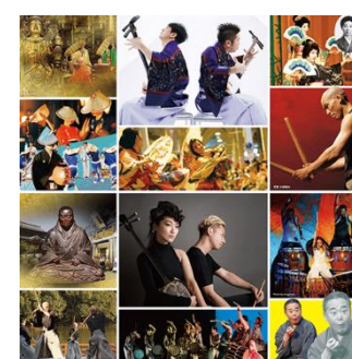
※4：アートミックスジャパン