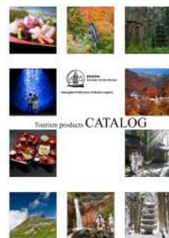
※8-2 訪日外国人向け 体験型ツーリズム資料