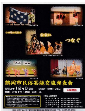
※4：鶴岡市民俗芸能交流発表会 (ポスター)

※3：酒井家 1622年、信州松代から入府し、 明治に至るまで庄内を治めた 徳川家の譜代大名。