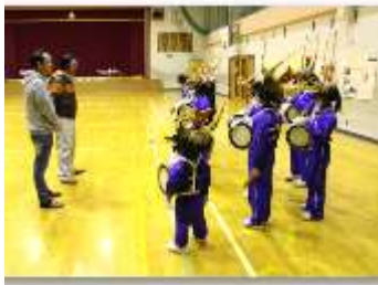
※7：東栄小学校 獅子舞りの練習