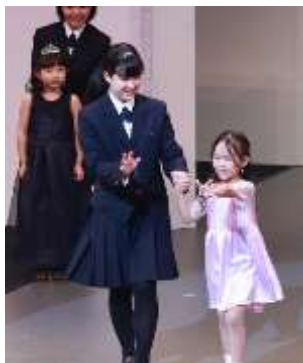
※2：シルクガールズコレクション

太下： 今回は「文化芸術と子どもたち」というテーマが設定されています。最初は遠田先生から、高校生の文化芸術活動と地域の関わりについてお願いします。