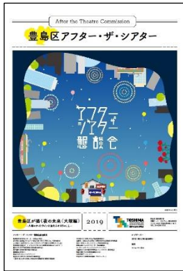
※6：豊島区アフター・ザ・シアター懇談会リーフレット

が豊島区の活動を支援している、自ら活動している、この状況が作られてきています。全国的にも稀有な事例です。豊島区の区長はなぜここまで文化に熱心なのかは理由があって、何年か前に消滅可能性都市という言葉が出てきました。将来の人口を推計していくと限りなく計算上ゼロになる。まちが消滅する自治体があるという衝撃的なレポートです。東京 23 区の中で豊島区は唯一消滅可能性になってしまいました。都心過疎があって、子どもが減っているという事実もあります。そのレポートに区長がショックを受けて、消滅しないようにするには人口を増やすしかない。ファミリー層に移住してもらう必要がある。まさに地方都市と同じことを考えています。移住してもらうにはいろんな選択肢があるかと思いますが、文化をチョイスしています。もともと区役所があった土地を民間が再開発をして「Hareza 池袋」というオフィスビルと劇場と複合施設を作りました。八つの劇場がこの施設に入っています。結果として豊島区の人口は増えています。文化的なイメージは上がってきている。更に、豊島区ではこれだけ劇場ができてお芝居を見に来る人が増える、お芝居の終わる時にまちで食事をしたり、飲みに行ったりするところが欲しい。「アフター・ザ・シアター(※6)」を政策としてあわせて展開しようとしています。国もナイトカルチャーを推進しようとしています。ヨーロッパは夜お芝居を見に行っ、遅い時間に食事をするライフスタイルですね。日本の場合、食事の後に行くところはカラオケくらいしかない。良質なエンターテイメントを文化芸術を楽しんでその後どこかで食事をする、そういう夜の活動を楽しむことがない。楽しむことがないということは、その分、お金が落ちていないということですね。どんどんまちを活性化させていこう、劇場を活用してアフター・ザ・シアターということも展開していこうとしています。