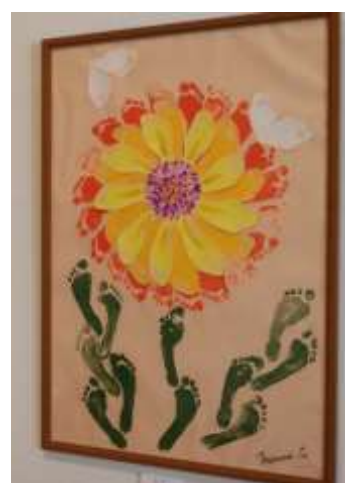
※5：障害者アート展出展作品