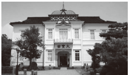
平成25年 鶴岡市教育委員会撮影