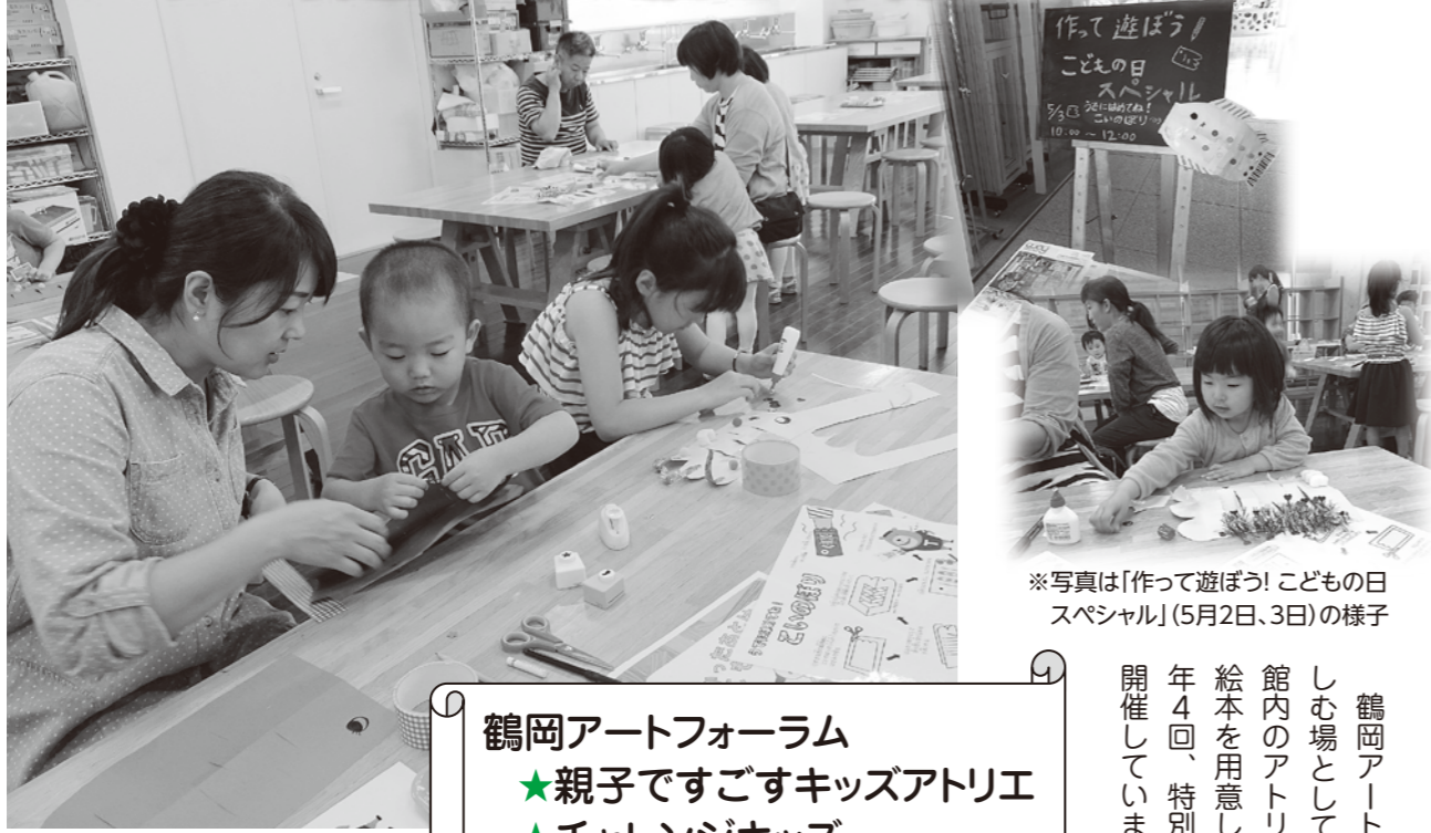
※写真は「作って遊ぼう!こどもの日スペシャル」(5月2日、3日)の様子