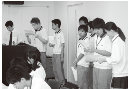
鶴岡東高等学校奉仕部の皆さん

最初に、地域でボランティア活動を頑張っている団体の皆さんから日頃の活動内容について発表していただきました。 鶴岡東高等学校奉仕部は、福祉にかかわる様々な団体や施設等と連携しながら、地元での活動から国際的な取り組みまで幅広く活躍する部署です。児童館での子どもたちと関わるボランティアや、市内のイベント協力、募金などに、自分たちも楽しみながら参加しています。学校祭では自分たちでフリーマーケットやエコバッグづくりを企画し、活動をPRしました。また、ボランティアについて学ぶ研修会にも積極的に参加しています。