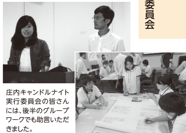
庄内キャンドルナイト実行委員会の皆さんには、後半のグループワークでも助言いただきました。

庄内キャンドルナイト実行委員会には、東日本大震災をきっかけに、山形大学農学部を学生を中心に結成された団体です。震災の記憶を風化させないため、キャンドルを灯してあの日の出来事や被災地に思いをはせるひと時を作りたいと、平成24年から毎年3月11日にキャンドルナイトを開催しています。その規模は年々大きくなり、関わる市民の輪も広がってきました。また、随時市内外のイベントに参加し、紙コップとカラフルなキューブ型ろうそくを使ったキャンドル作りのワークショップを行っています。参加者からも「楽しそう」「自分もやってみよう」という声がありました。(4面に続く)