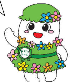
鶴岡市エコキャラ 「みどりちゃん」