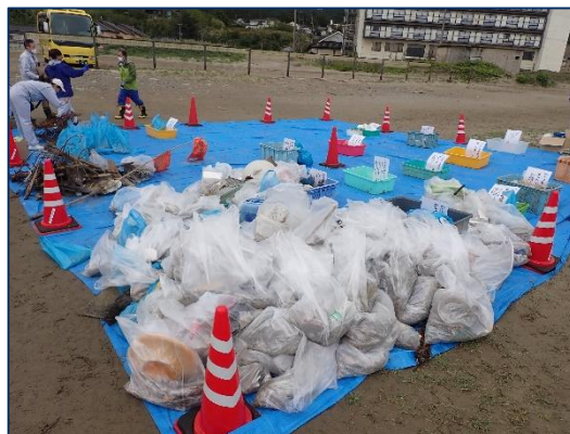
昨年回収したごみ