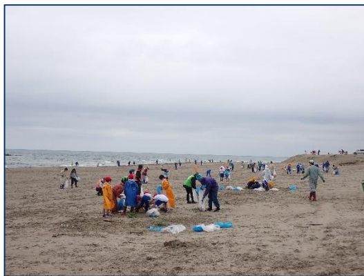
昨年のクリーン作戦の様子

海岸のごみを拾いながら、世界的な課題となっている海洋プラスチックごみ問題を考えてみませんか？