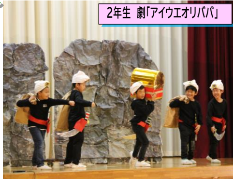
2年生 劇「アイウエオリババ」