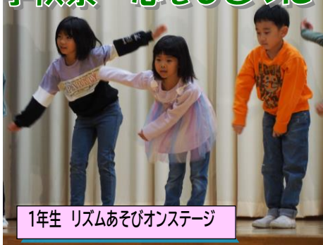
1年生 リズムあそびオンステージ