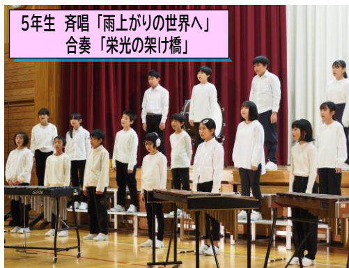
5年生 斉唱「雨上がりの世界へ」 合奏「栄光の架け橋」