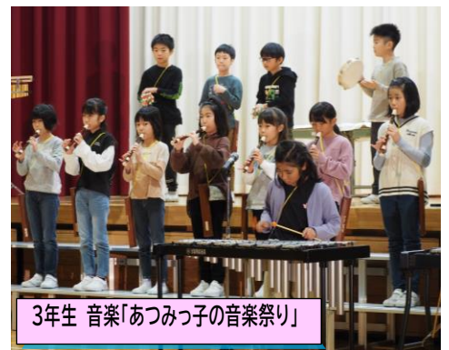
3年生 音楽「あつみっ子の音楽祭り」