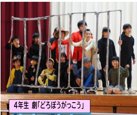
4年生 劇「どろぼうがっこう」